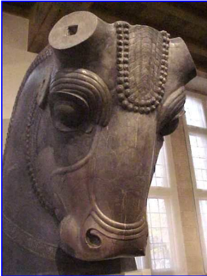
Tête de taureau, Persépolis, (V e siècle av. l'ère chrétienne, Empire achéménide)