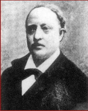
Joseph Halévy (1827-1917)