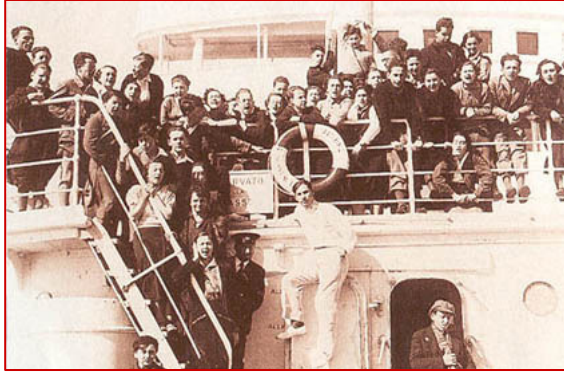
L'un des bateaux d'immigrants qui amenait les juifs à Akko (st Jean d'Acre) au lendemain de la Shoah.