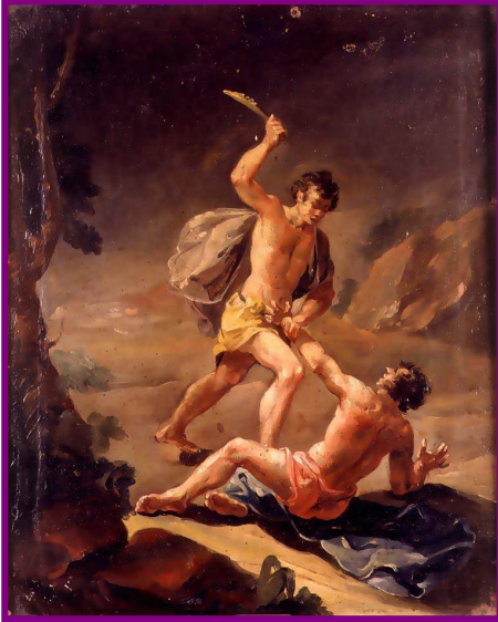
Caïn tue Abel