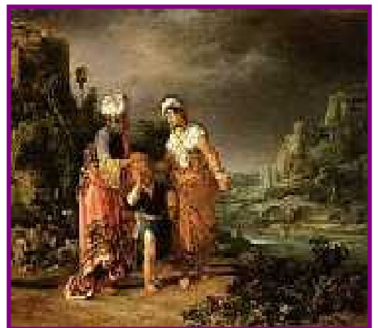
Renvoi d'Hagar et Ismaël

Abraham reçoit par la suite la visite de trois anges qui lui annoncent que sa femme Sarah enfantera un fils. Sarah se met à rire, car elle avait passé l'âge de mettre au monde des enfants. Et pourtant, un an plus tard, Sarah donne naissance à un fils: Isaac. Un jour, voyant Ismaël se moquer de son frère Isaac, Sarah demande à Abraham de renvoyer Hagar et Ismaël. Ainsi, la rivalité des tribus d'Ismaël et d'Isaac vient de commencer.