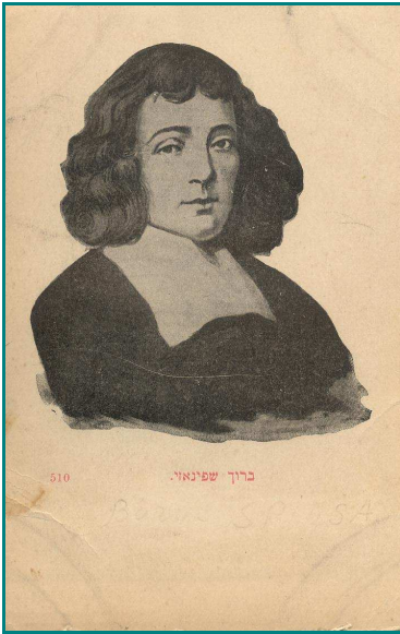
Carte postale représentant Baruch Spinoza imprimée en Russie au début du XX e siècle.