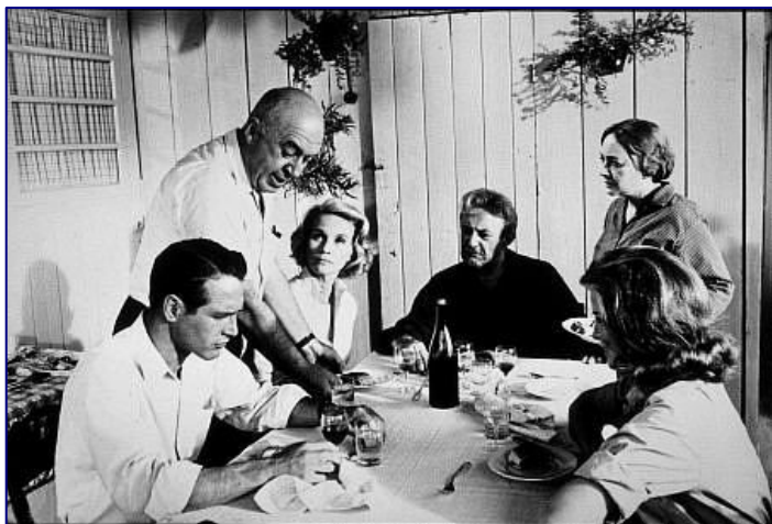
Exodus d'Otto Preminger est l'un des chefs-d'œuvre du cinéma mondial