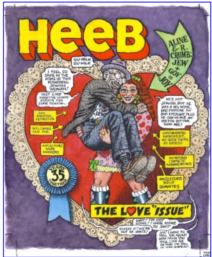
Aline Kominsky est mariée avec Robert Crumb, figure de la BD underground des années 1970. Ils se représentent souvent ensemble. Ici, la formule résumé de leur union « jew + goy » = joy ».