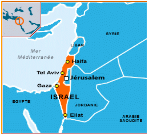
Israël et ses voisins