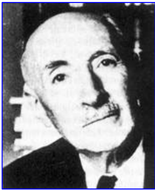
Jules Isaac est l'un des fondateurs de l'Amitié Judéo-chrétienne