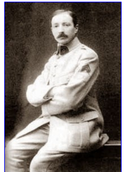
Jules Isaac à l'âge de 18 ans

1963 : Jules Isaac meurt à Aix-en-Provence.