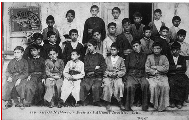
Les élèves de l'Alliance à Tétouan (1910)