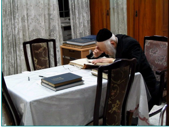
Etudier la Tora, c'est laper quelques gouttes d'eau d'un océan infini.