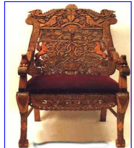
La chaise de Rabbi Nahman