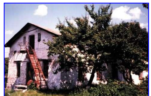
Ukraine, ville d'Ouman, c'est à cet endroit que Rabbi Nahman quitte ce monde