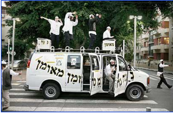
Les « breslev », suivent les enseignements de leur maître parmi lesquels la danse et la joie...