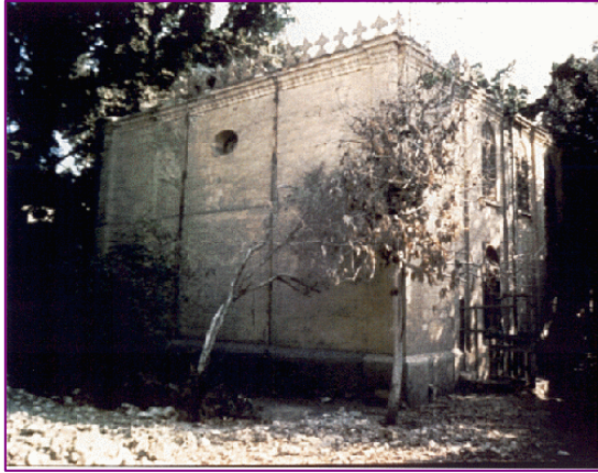
L'ancienne synagogue de Fostat Ben Ezra (près du Caire) où pria Maïmonide de longues années jusqu'à sa mort.