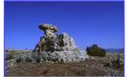
Les Cévennes : encore aujourd'hui, de nombreux protestants se rendent en pèlerinage au "désert".

Suivent deux années de guerre. En automne 1703, les soldats français détruisent plus de 500 villages, afin de priver les révoltés du soutien de la population. C'est le "brûlement des Cévennes". Les populations sont déplacées, mais beaucoup rejoignent les Camisards. En 1704, les derniers chefs se rendent mais les affrontements surent encore quelques années.