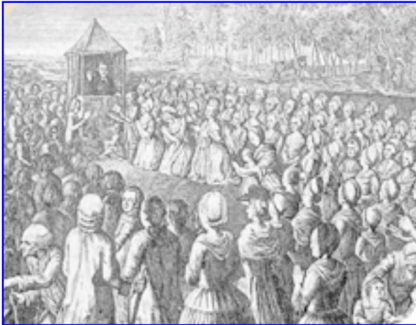
Assemblée au désert : les protestants se rassemblaient clandestinement pour leurs offices.