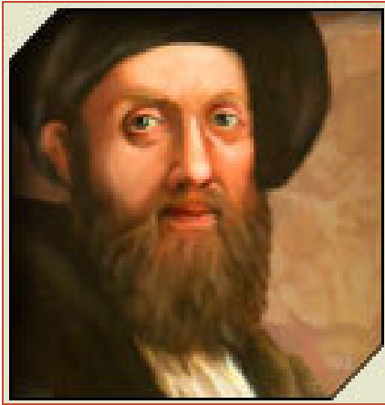
Portrait imaginaire d'Isaac Luria basé sur le portrait de Baldassare Castiglione par Raphaël (Studio Barzel)