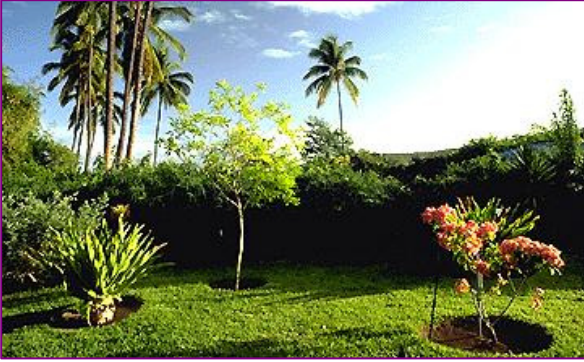
Dieu place Adam dans le jardin d'Eden, jardin de jouissance, à la seule condition ne pas consommer du fruit interdit. Par la transgression d'Adam, Dieu s'éloigne un peu de ce monde.