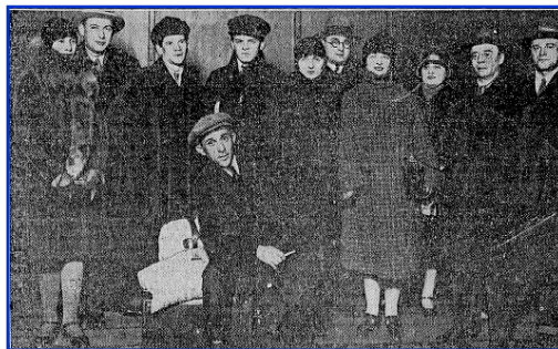
1. Salomon Mikhoels et Albert Einstein 2. La troupe du GOSET (Mikheols est assis au centre) en route pour l'Europe, Riga, Lettonie, 1928