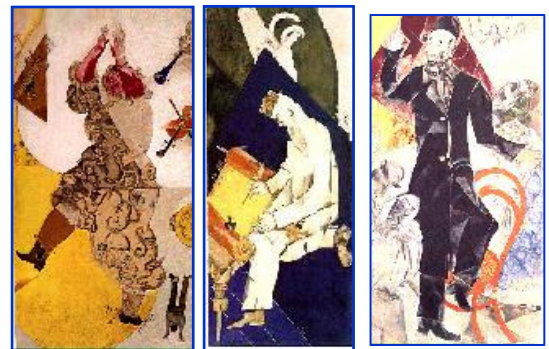
Détails du décor peint par Marc Chagall